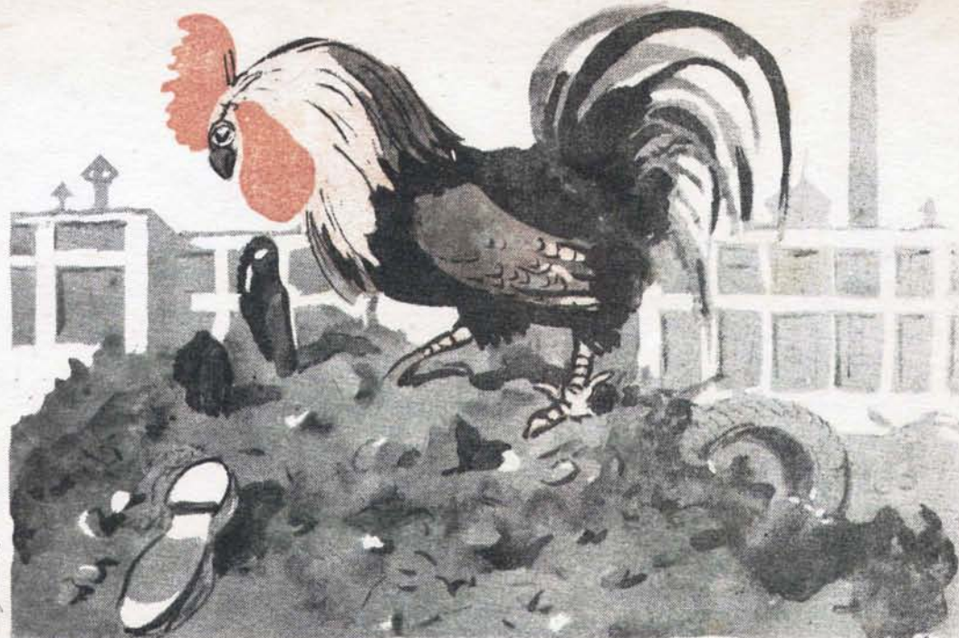
Навозну кучу разрывая, петух нашёл на свалках свердловской фабрики «Уралобувь» много тонн ценных отходов кожи.