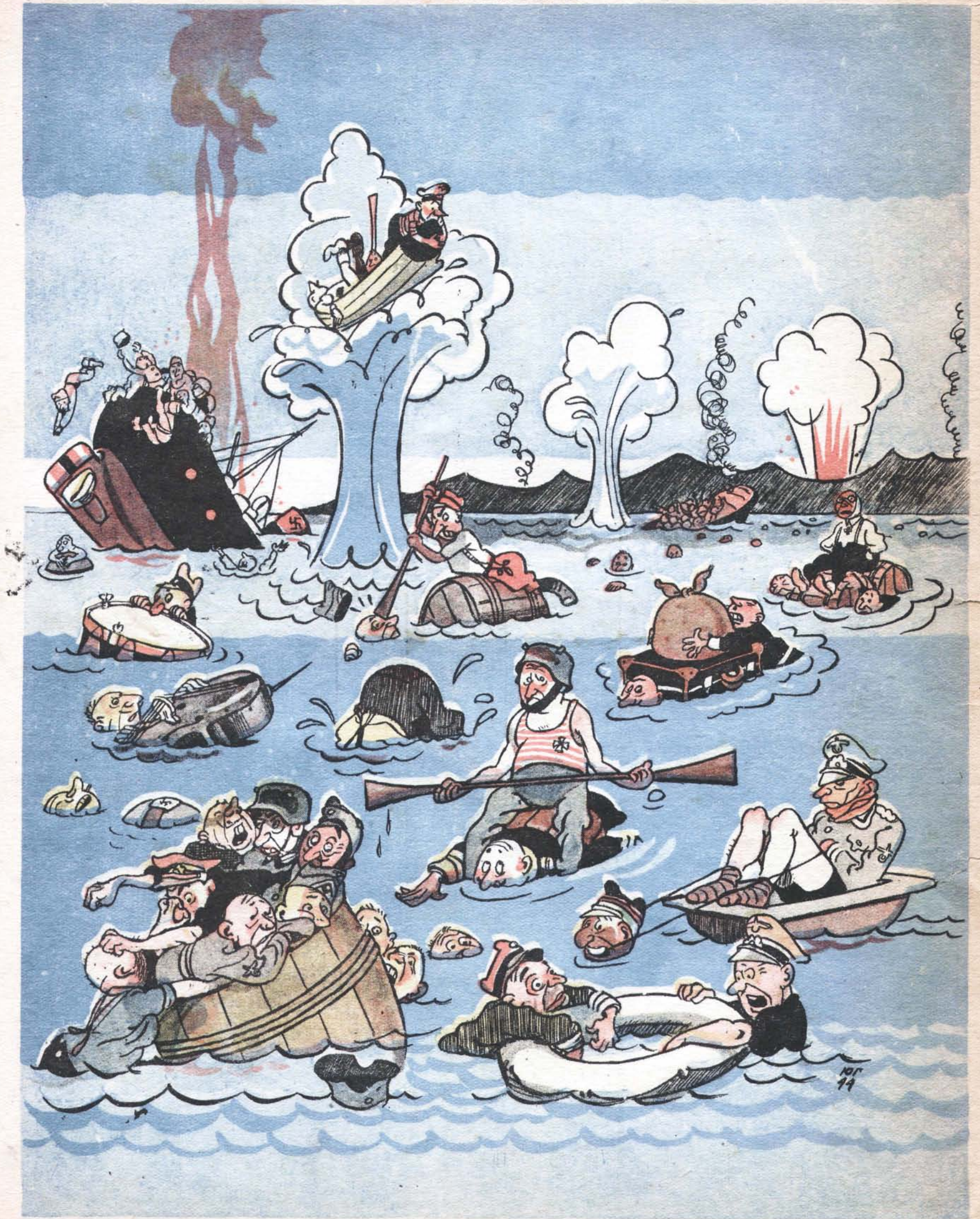
«Планомерное отступление» немецко-румынских войск из Севастополя.