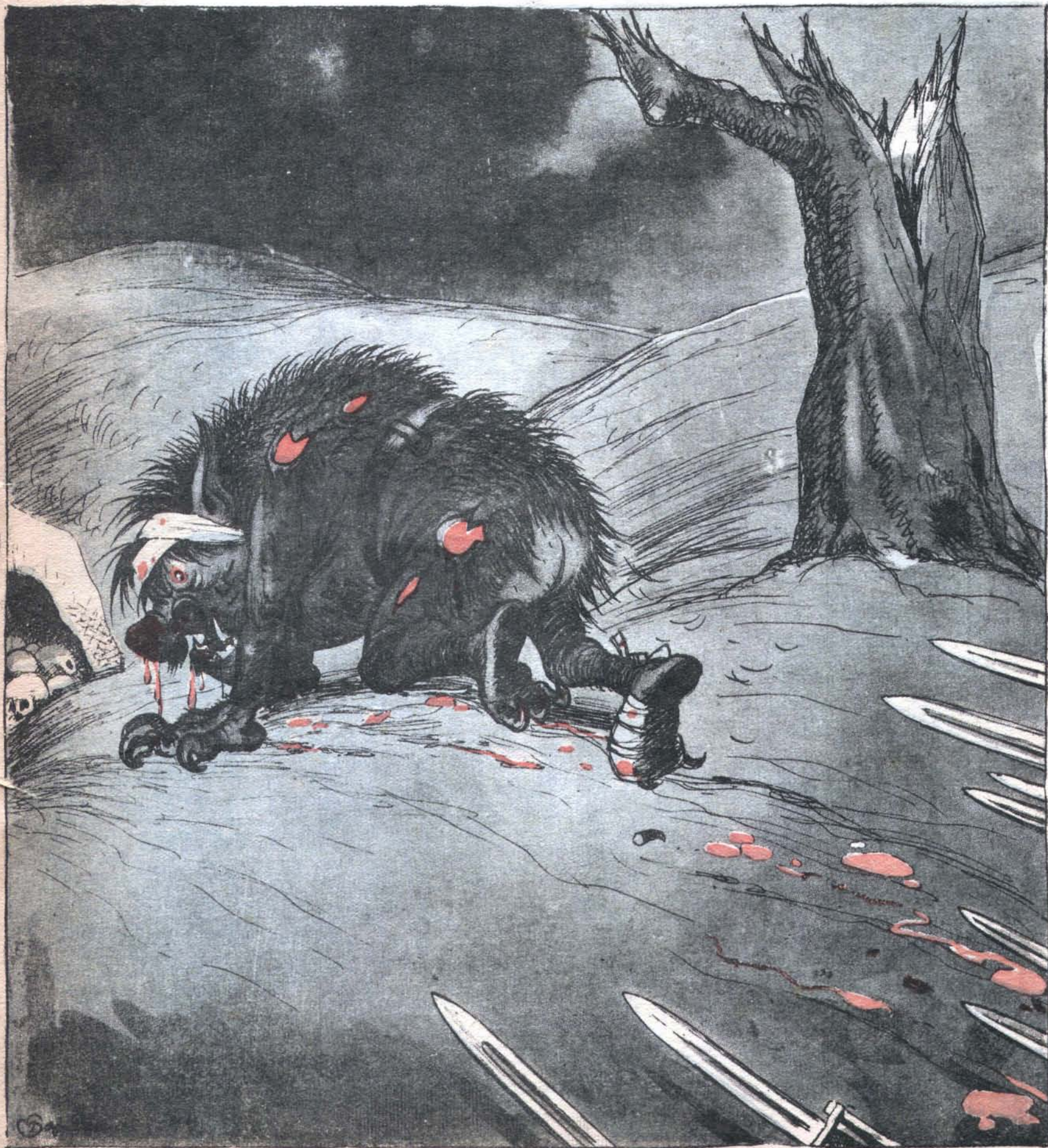
Рис. Бор. Ефимова